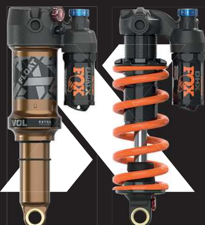
ALL-NEW FLOAT X AND DHX