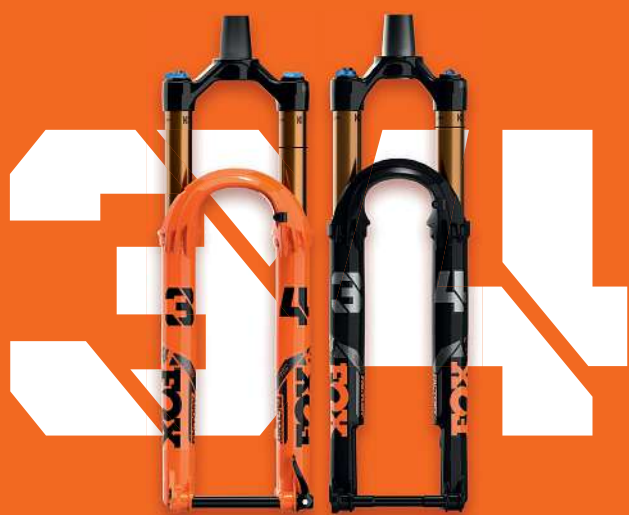
ALL-NEW 34 AND 34 STEP-CAST