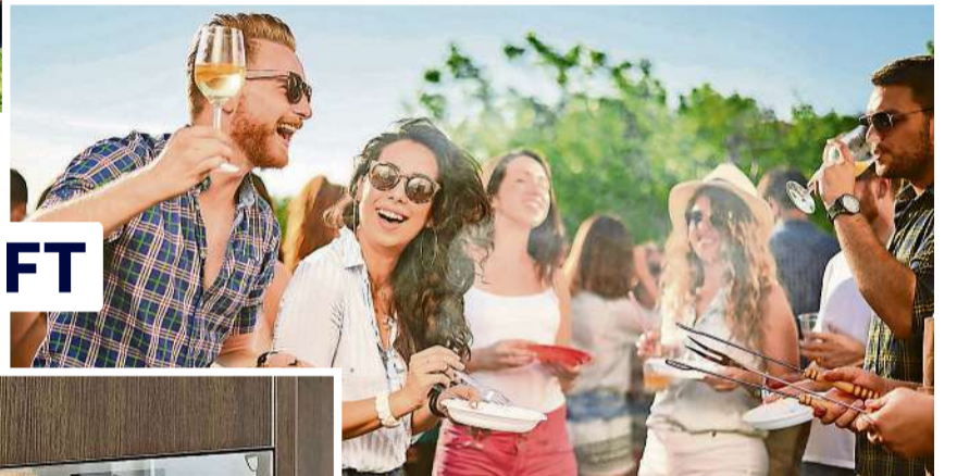
Bratworscht, Brot und Bier FESTWIRTSCHAFT