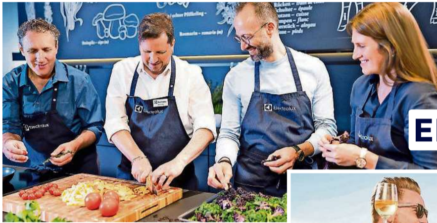
Showkochen mit ELECTROLUX