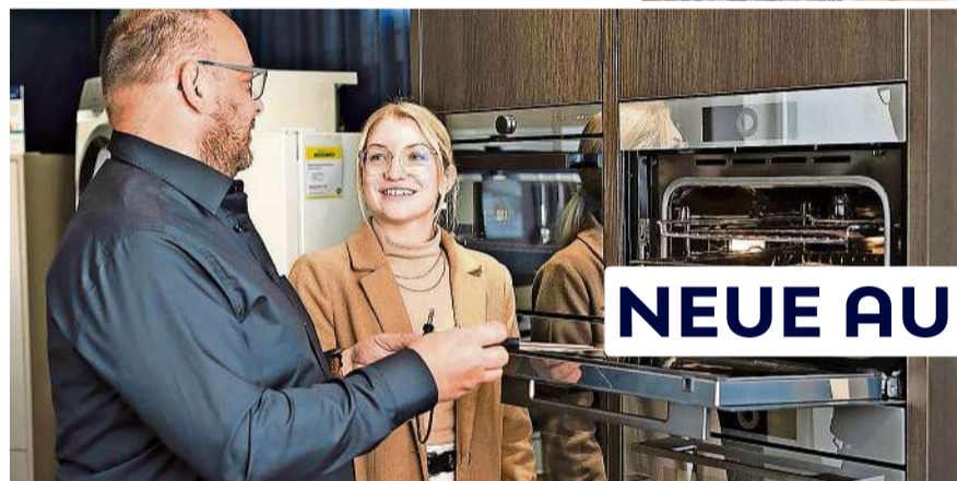
Persönliche Beratung NEUE AUSSTELLUNG