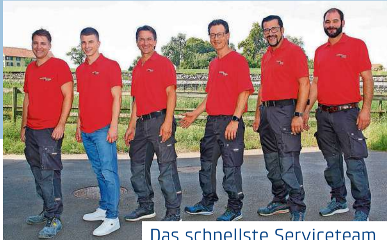
Das schnellste Serviceteam

Kundenzufriedenheit hat für uns oberste Priorität. Wir hören aufmerksam zu und nehmen die Bedürfnisse unserer Kunden ernst. Unser Team arbeitet eng mit Ihnen zusammen, um massgeschneiderte Lösungen zu finden, die Ihren Anforderungen entsprechen und Ihr Budget berücksichtigen. Transparente Kommunikation und faire Preise sind uns wichtig, damit Sie sich bei jedem Schritt des Prozesses wohlfühlen.