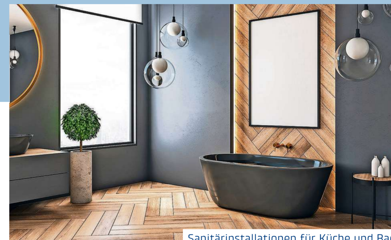
Sanitärinstallationen für Küche und Bad

Kommen Sie auf uns zu, wir beraten Sie gerne individuell.