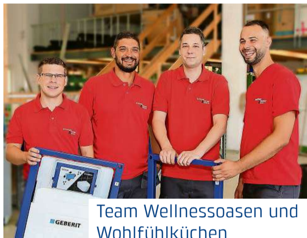
Team Wellnessoasen und Wohlfühlküchen

Unser Team ist spezialisiert auf die Planung und den Bau von Wellnessoasen und Wohlfühlküchen. Mit jahrelanger Erfahrung und Leidenschaft für Design und Funktionalität schaffen wir einzigartige Räume, die Entspannung und Genuss vereinen. Von der Konzeption bis zur Umsetzung legen wir grossen Wert auf individuelle Kundenwünsche und Nachhaltigkeit. Unsere Experten arbeiten Hand in Hand, um harmonische Atmosphären zu schaffen, die Körper und Geist verwöhnen. Jedes Projekt ist für uns eine einzigartige Herausforderung, die wir mit höchster Professionalität und Kreativität angehen. Lassen Sie sich von unseren Wellnessoasen und Wohlfühlküchen verzaubern!