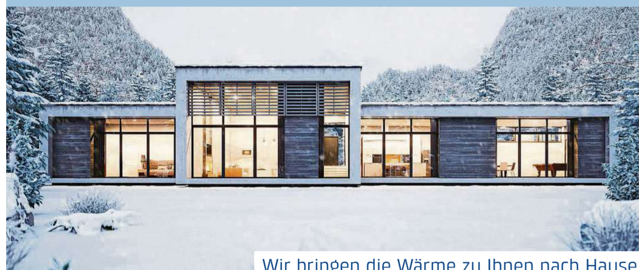
Wir bringen die Wärme zu Ihnen nach Hause

Die moderne Heiztechnik bietet vielfältige Möglichkeiten. Jedes Heizsystem hat seine Vor- und Nachteile. Darum gilt es, bei Planung und Bau alle relevanten Faktoren zu berücksichtigen. Wie ist der Zustand des Gebäudes? Wie wird es genutzt? Welche Rolle spielt die Nachhaltigkeit? Ob Luft-/Wasser-Wärmepumpe, Gasheizung, Holzfeuerung oder Fernwärme, wir ermitteln gemeinsam mit Ihnen die beste Lösung für Ihr Gebäude.