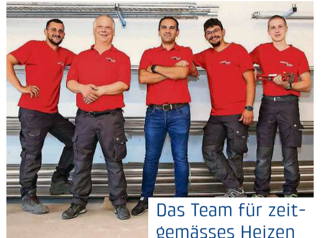
Das Team für zeitgemässes Heizen

Vertrauen Sie dem Serviceteam von Schöenberger & Partner und lassen Sie uns Ihre Heizung und sanitären Anlagen in Topform halten. Mit unserem kompetenten und engagierten Team sind wir immer bereit, Ihnen die beste Lösung zu bieten, damit Sie sich in Ihrem Zuhause rundum sicher und wohlfühlen können.