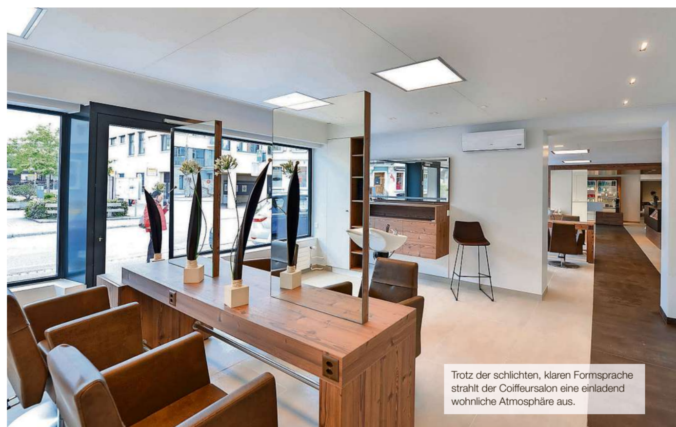
Trotz der schlichten, klaren Formsprache strahlt der Coiffeursalon eine einladend wohnliche Atmosphäre aus.