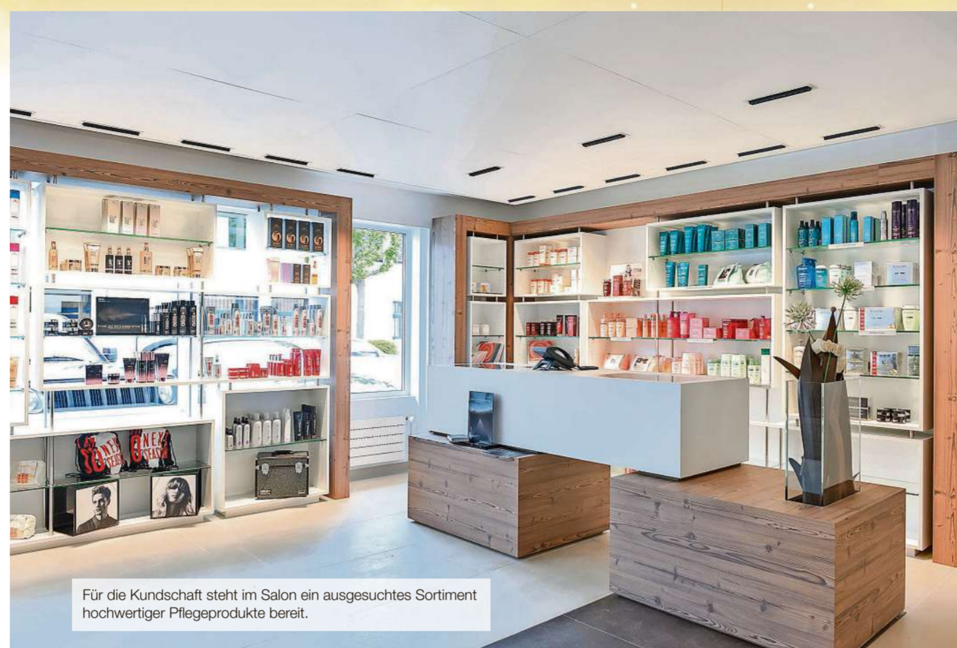
Für die Kundschaft steht im Salon ein ausgesuchtes Sortiment hochwertiger Pflegeprodukte bereit.