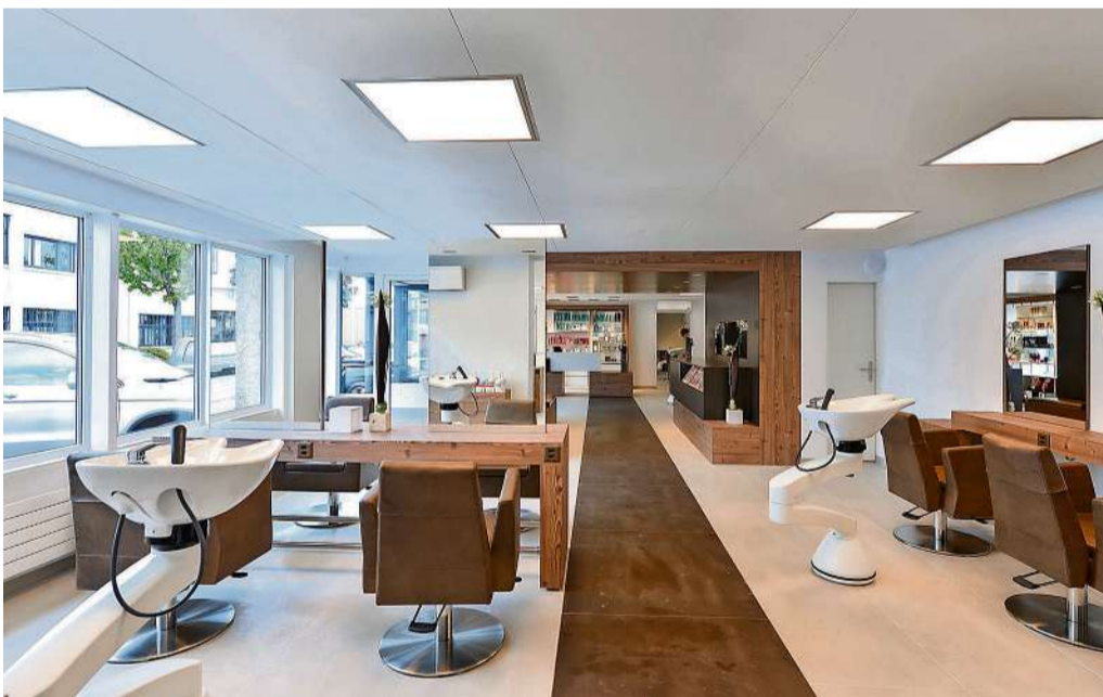
Die komplette Modernisierung und Erweiterung im Jahr 2017 verleiht dem Salon ein zeitlos schönes Aussehen. Das gesamte Interieur und die Infrastruktur wurden erneuert und modernisiert.