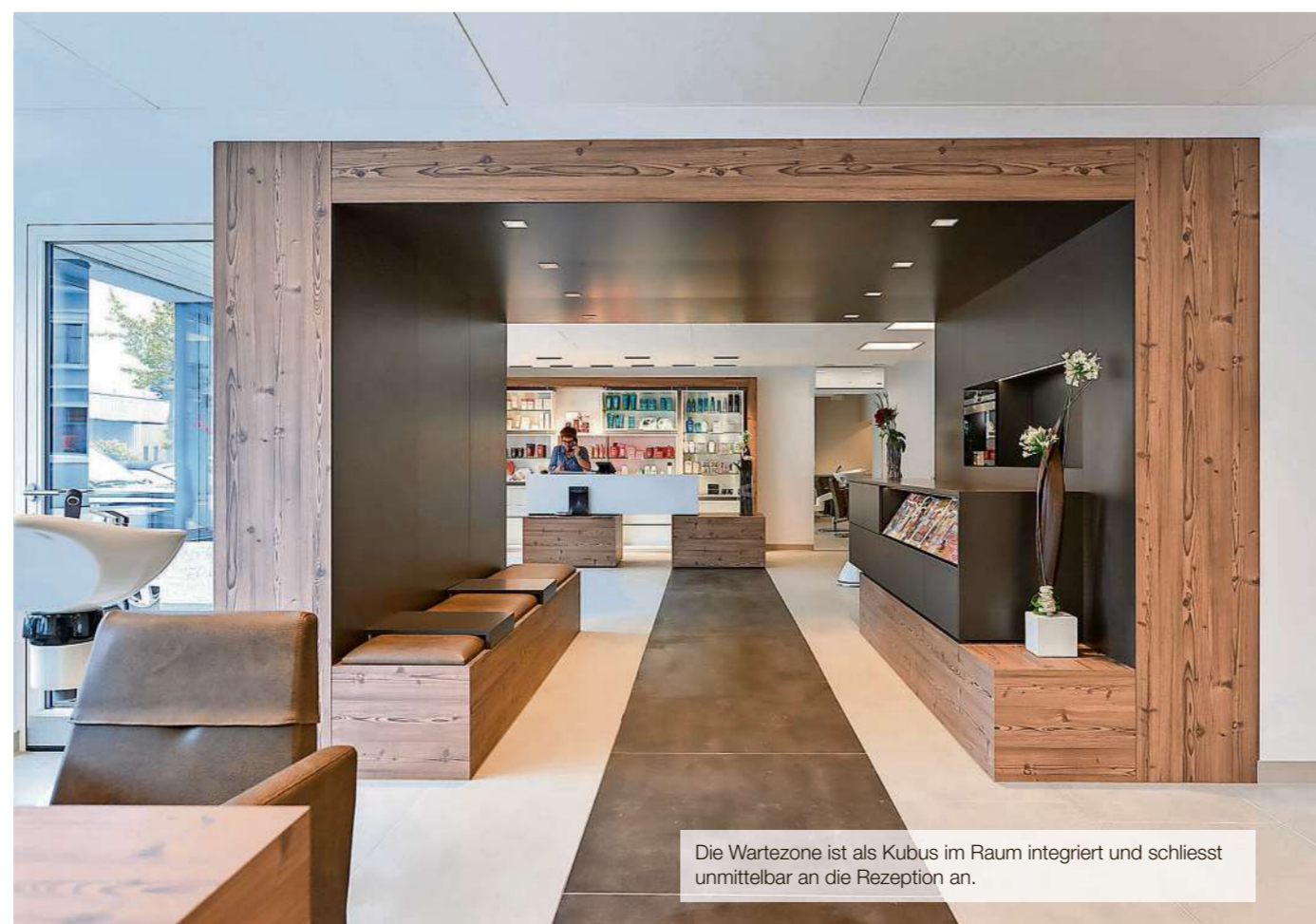
Die Wartezone ist als Kubus im Raum integriert und schliesst unmittelbar an die Rezeption an.