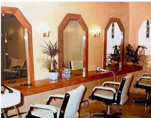
Der Salon wird 1990 auf insgesamt zehn Plätze erweitert und modernisiert.