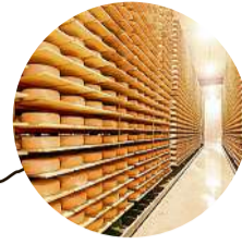
2000 Neubau Werk 1 Tilsiter Keller

Erfolg unseres Unternehmens ausmacht. Unsere Mitarbeiter, ihre Erfahrung, ihr Engagement und ihre Begeisterung für die Produkte, die wir herstellen, das zeichnet die Hardegger Käse AG aus und macht sie erfolgreich.