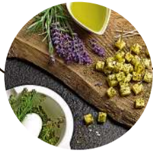
2019 Neubau Convenience-Abteilung