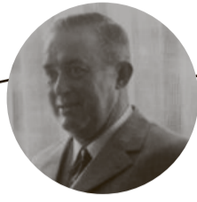
1956 Gründung Hardegger Käse