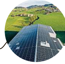
2020 Inbetriebnahme Photovoltaikanlage