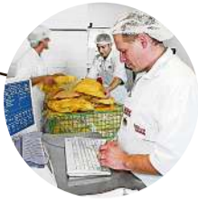
1996 Neubau Spedition