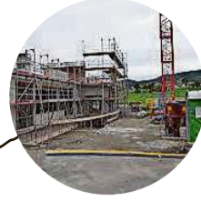
2018 Neubau Käseproduktion und Käselager