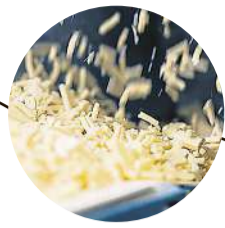
2024 Neubau Reibkäseproduktion