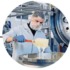
2015 Neubau Werk 4 Schmelzwerk