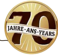
2026 70 Jahre Hardegger Käse